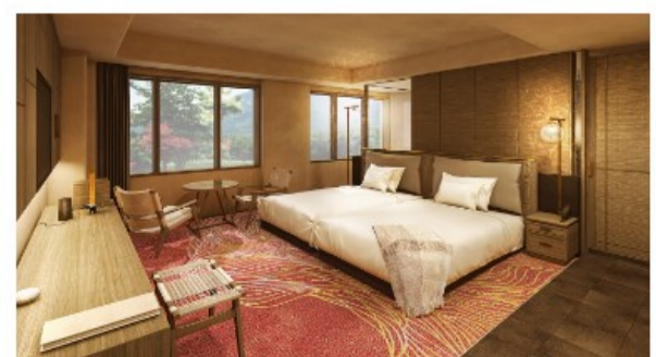
ホテル客室イメージ